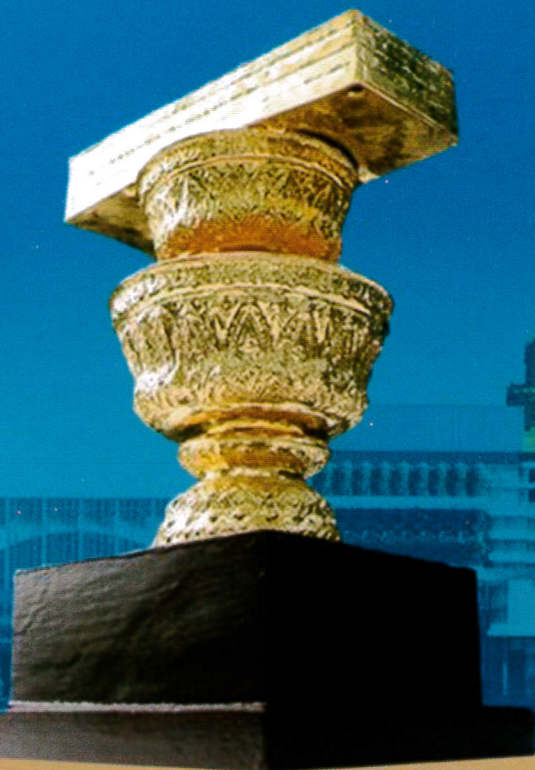
2 ทศวรรษพานแว่นฟ้า