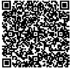
ตัวอย่างประกาศฯ ม.๑๐ และคำสั่งฯ ม.๑๖ https://bit.ly/3CLKiEK

๔.๓ นำไฟล์ข้อมูลประกาศฯ มาตรา ๑๐ และคำสั่งฯ มาตรา ๑๖ เข้าสู่ระบบศูนย์รวมข้อมูลเพื่อติดต่อราชการ (info.go.th) ในรูปแบบ PDF