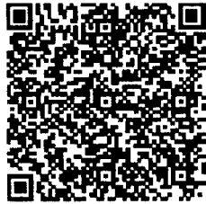
คู่มือการใช้งานระบบ info.go.th https://cityly.me/QWctx