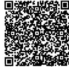
คำถาม - คำตอบเกี่ยวกับ ระบบ info.go.th https://bit.ly/3OsmJDq